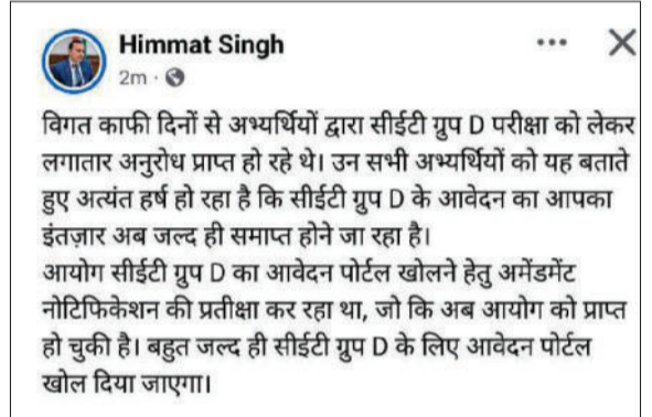
नारनौल। सोशल मीडिया पर किया पोस्ट।

हरियाणा में सीईटी ग्रुप-डी भर्ती को लेकर लंबे समय से इंतजार कर रहे लाखों युवाओं के लिए राहत भरी खबर सामने आई है। आयोग को भर्ती प्रक्रिया से संबंधित आवश्यक संशोधन नोटिफिकेशन प्राप्त हो चुका है और अब बहुत जल्द आवेदन पोर्टल खोलने जाने की तैयारी अंतिम चरण में है। पिछले कई दिनों से अर्न्तर्गत सोशल मीडिया और विभिन्न माध्यमों से परीक्षा तिथि व आवेदन प्रक्रिया को लेकर स्पष्ट सूचना की मांग कर रहे थे। ताजा अपडेट के बाद युवाओं में नया उत्साह देखने को मिल रहा है और वे आवेदन प्रक्रिया शुरू होने की आधिकारिक घोषणा का बेसब्री से इंतजार कर रहे हैं। सूत्रों के अनुसार आयोग ने प्रशासनिक स्तर पर अधिकांश तैयारियां पूरी कर ली