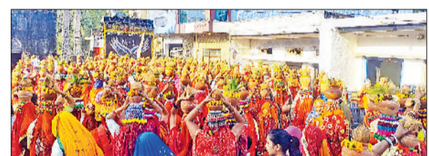
मंडी अटेली। दौंगड़ा अहीर कलशा लेकर परिक्रमा करती महिलाएं।

जागरण, हवन-यज्ञ एवं कलशा यात्रा के बाद विशाल भंडारा आयोजित