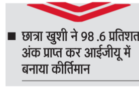
महेन्द्रगढ़। आरपीएस के विद्यार्थियों ने लहराया परचम।