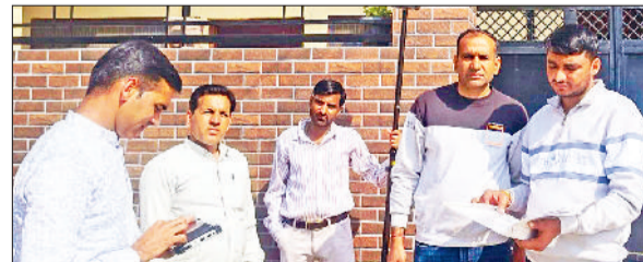
नारनौल। नक्शा प्रोजेक्ट के तहत सर्वे में लगी टीम।