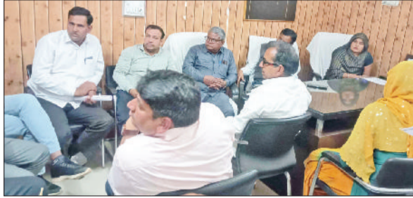
नंगल चौधरी। नपा बैठक में विकास कार्यों में लेटलैती पर विचार विमर्श करते पार्षद।