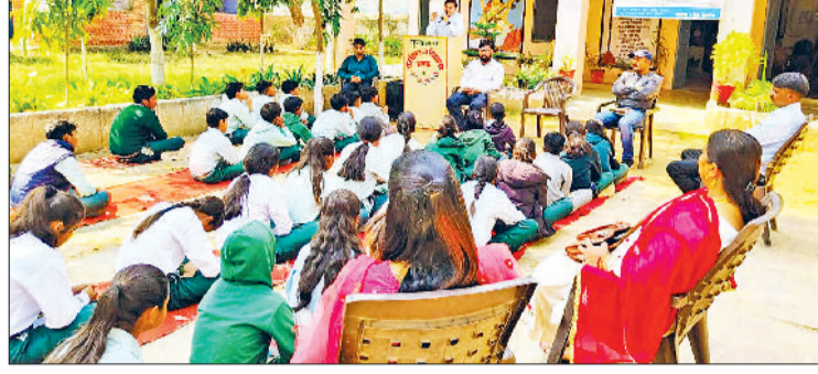
नारनौल। भड़फ विद्यालय में बच्चों को जल संरक्षण का संदेश देते जिला सलाहकार।

पृथ्वी पर लगभग दो तिहाई भाग पानी से घिरा हुआ है, लेकिन पीने योग्य जल बहुत सीमित मात्रा में उपलब्ध है। इसलिए हमें पेयजल की प्रत्येक बूंद का महत्व समझते हुए उसका संरक्षण करना चाहिए।