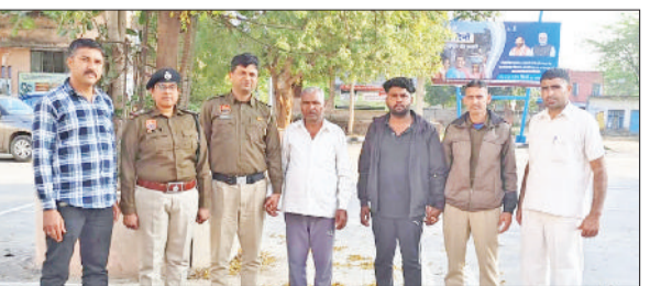
नारनौल। पुलिस गिरफ्त में आरोपित।