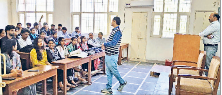
महेन्द्रगढ़। विद्यार्थियों को संबोधित करते हुए।